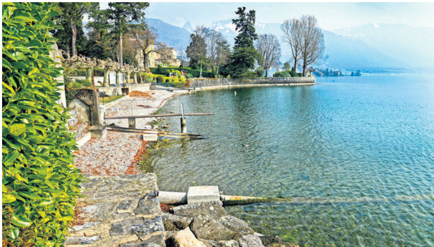
Le bord du lac à La Tour-de-Peilz. CHANTAL DERVEY

Dans les journaux il y a régulièrement des articles concernant l'accès public aux bords du Léman.